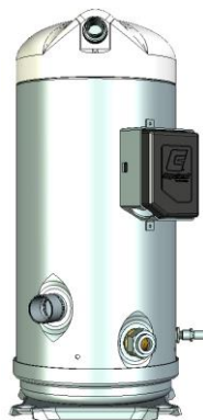
BOM 455 (IP21)

Комплектации (BOM) 455 и 411 могут использоваться в тандемах, и отгружаются без опор, которые надо заказывать отдельно.